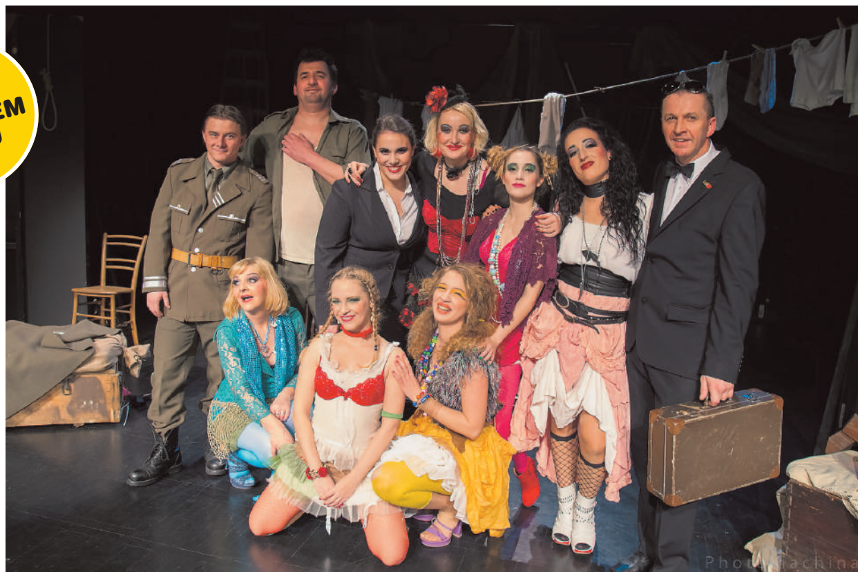
Igralska zasedba iz predstave Kurbe

Najbolj iskana, zaželena in potrebna med gledalci je komedija – Nekaj najlepšega, kar lahko igralec dobi in si zasluži, je nagrada občinstva